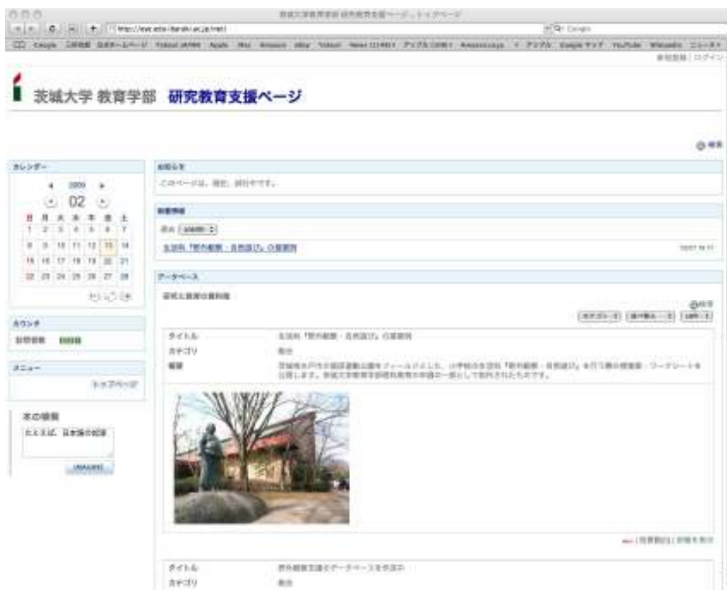
図6 茨城大学教育学部研究教育支援ページに掲載されている様子