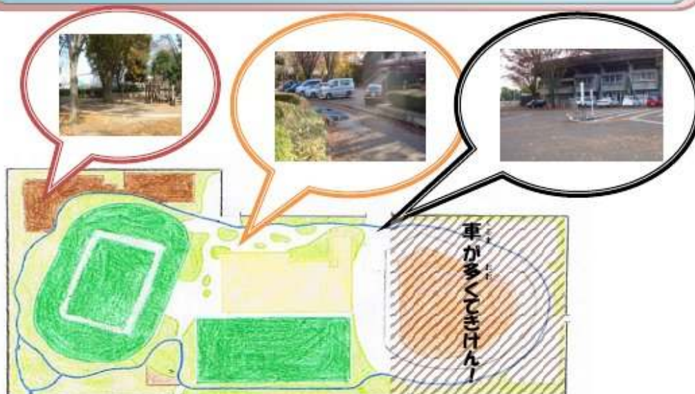
図4 ワークシートC：「ほりはらうんどう公園であそぼう」