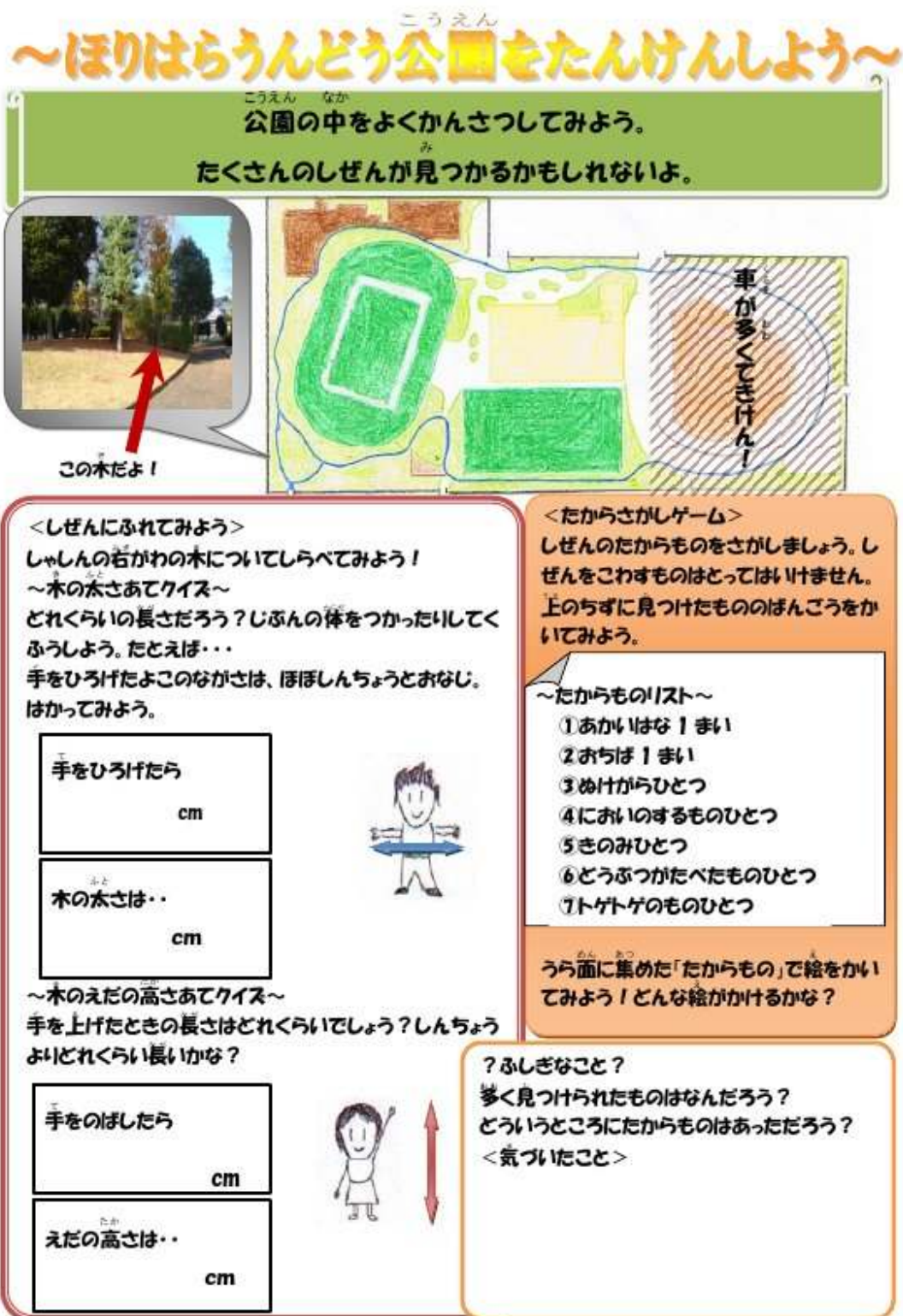
図3 ワークシートB：「ほりはらうんどう公園をたんけんしよう」